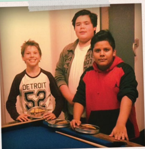
UND WÜBTE ICH ALLE GEHEIMNISSE...