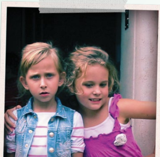
...SO WÄRE ICH NICHTS!