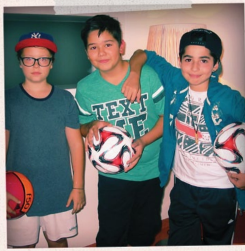
UND HÄTTE DIE LIEBE NICHT...